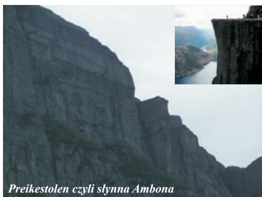
Preikestolen czyli słynna Ambona

kich udogodnieniach współczesnej cywilizacji. Nie dziwi też groza średniowiecznych Wikingów, którzy z tych otoczonych górami wiosek wyruszali na podbój i po łupy grabione w wielu zakątkach Europy.