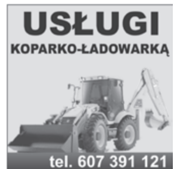
tel. 607 391 121

AUTO-CZĘŚCI ul. Średnia 17 21-010 Łęczna