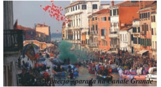
Wenecja - parada na Canale Grande

Karnawał kończy się o północy z wtorku na środę popielcową. Wówczas w całym mieście