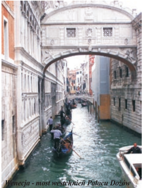
Wenecja - most westchnień Pałacu Dożów

Zapusty, mięsopusty, to staropolskie nazwy karnawału. W wielu krajach Europy karnawałem nazywano czas liczony od Nowego Roku, aż do dnia poprzedzającego środę popielcową. Wtedy czas upływał na ucztach, zabawach, maskaradach i wszelkich radościach.