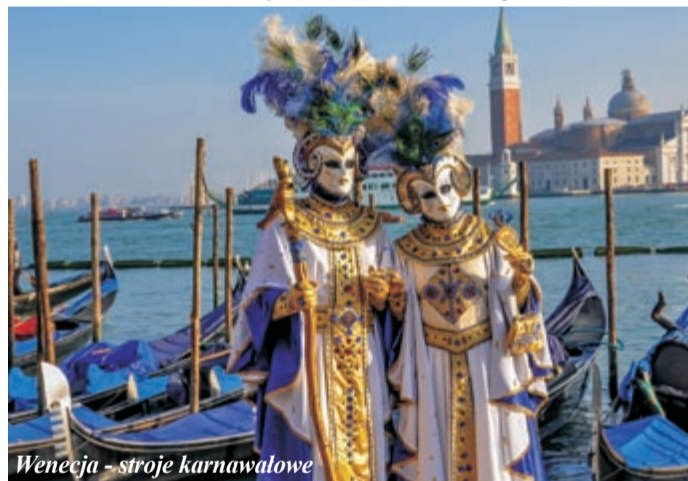
Wenecja - stroje karnawałowe

Władze chciały jednak dbać o bezpieczeństwo i moralność. Zakazano noszenia kostiumów poza okresem karnawału, wchodzenia w nim do kościoła i kasyne. W roku 1603 zabroniono mężczyznom przebierania się za kobiety i odwiedzania zakonnic w żeńskich klasztorach. Później nie było wolno nosić pod kostiumem ostrych przedmiotów. Za złamanie zakazu mężczyznom