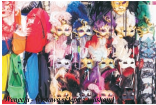
Wenecja - wystawa sklep z maskami

twarży, mocno dokazywali. Obyczajowość zaczęła upadać, dlatego władze miasta zaczęły ograniczać noszenie masek różnymi aktami prawnymi. To było jednak trudne, bo maski realizowały jedno z przesłań karnawałowych