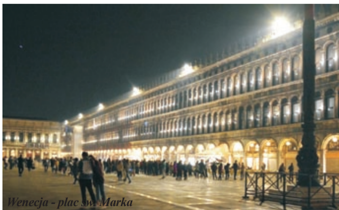
Wenecja - plac św. Marka

Tu możemy powiedzieć, że pierwsze obchody imienin Sylwestra odbyły się w 999 roku. miało to jednak związek z procektwem Sybilli, wedle którego w roku następnym nastąpić miał koniec świata. Mieszkańcy Rzymu przywitani więc 31 grudnia na kolanach, spodziewając się rychłego sądu ostatecznego.