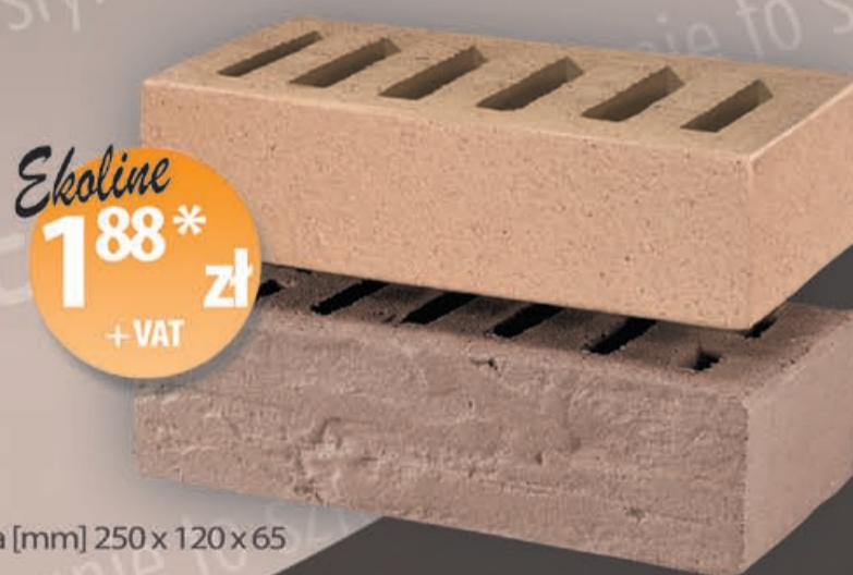
Cegła elewacyjna [mm] 250 x 120 x 65