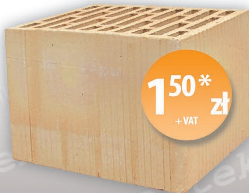
Pustak ceramiczny MAX [mm] 188 x 288 x 220