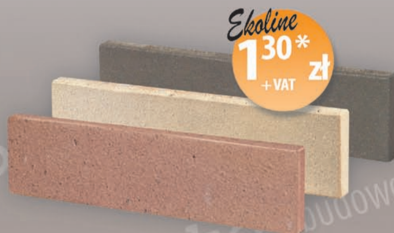
Płytki elewacyjna [mm] 250 x 13 x 65