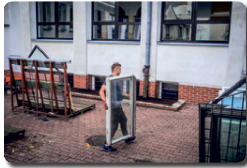
Funduszu Inwestycji Lokalnych. Koszt prac to 1,17 mln złotych. Pozostałe środki zostaną przeznaczone na kolejne działania termomodernizacyjne.

Na wymianę stolarki okiennej i drzwiowej gmina Łęczna otrzymała 2 mln zł z Rządowego